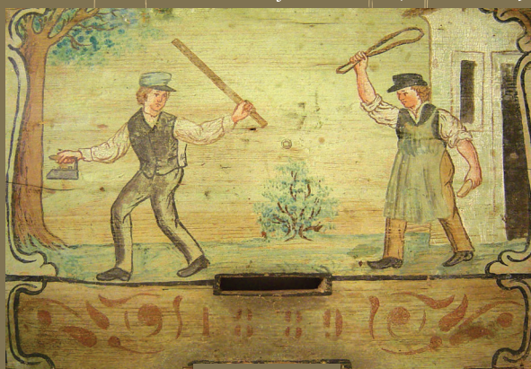
Krojač in čevljar se tepeta, z letnico 1889.