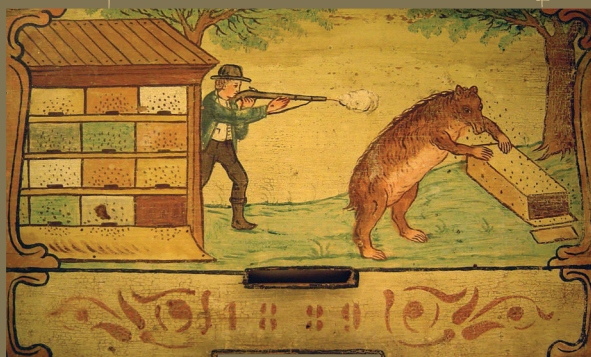
Čebelar strelja na medveda, z letnico 1889.