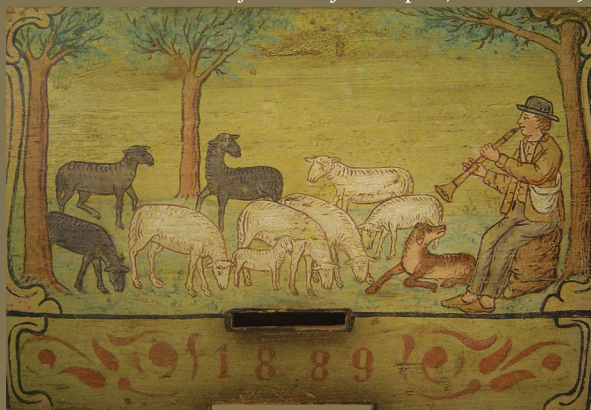
Ovčji pastir, z letnico 1889.