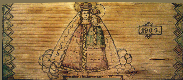
Božjepotna Marija, z letnico 1903.